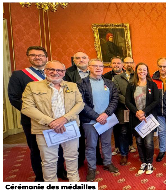
Cérémonie des médailles