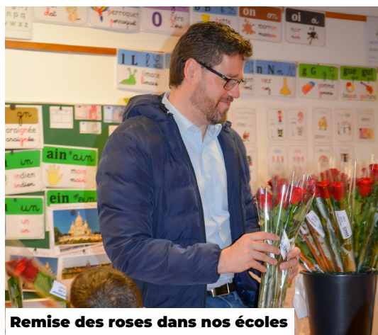
Remise des roses dans nos écoles