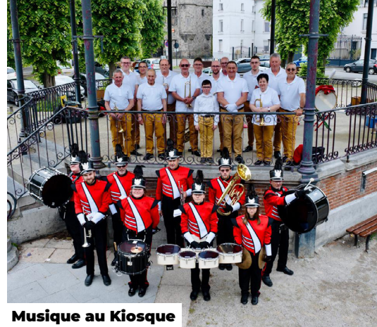
Musique au Kiosque