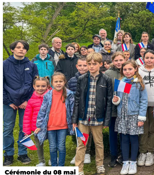
Cérémonie du 08 mai