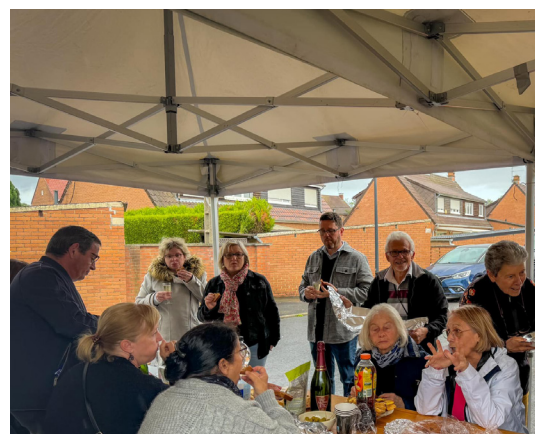
Fête des voisins