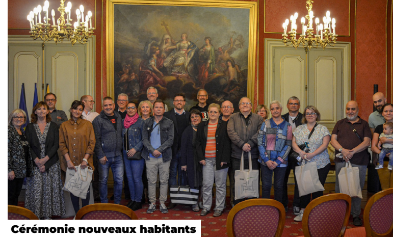
Cérémonie nouveaux habitants