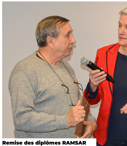
Remise des diplômes RAMSAR