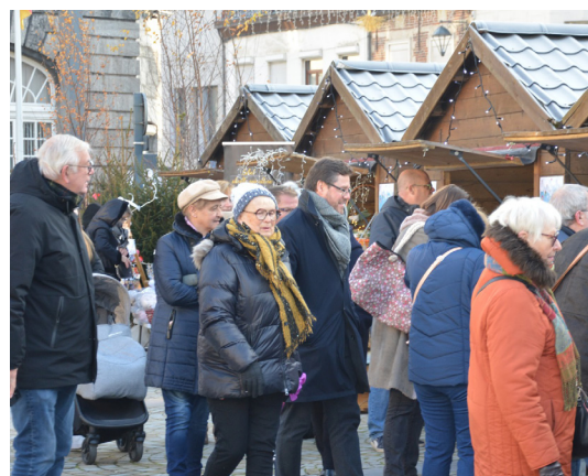
Village de Noël