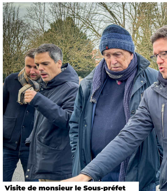
Visite de monsieur le Sous-préfet