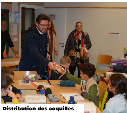
Distribution des coquilles