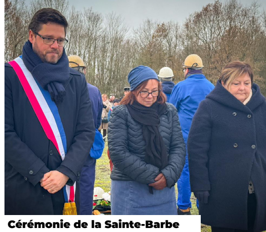
Cérémonie de la Sainte-Barbe