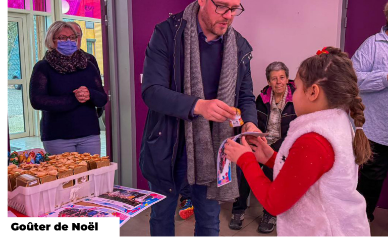
Goûter de Noël