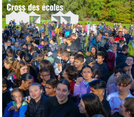
Cross des écoles

C'est le montant des dépenses énergétiques pour l'année 2022 contre 600 000 € en 2021.