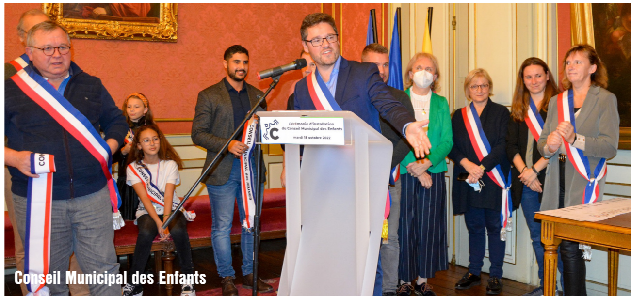
Conseil Municipal des Enfants