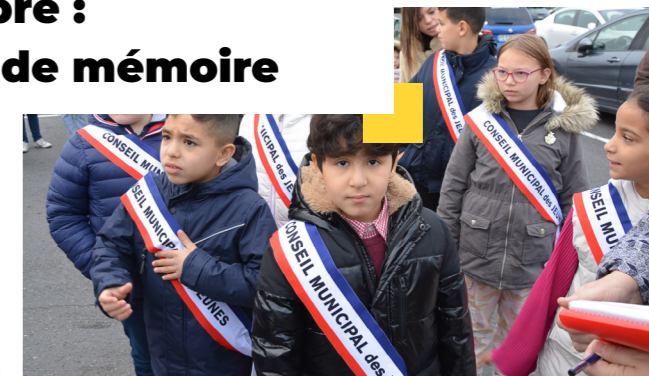
De futurs citoyens investis

"Honneur à nos grands morts. Grâce à eux, la France, hier soldat de Dieu, aujourd'hui soldat de l'humanité, sera toujours soldat de l'idéal", Georges Clémenceau.