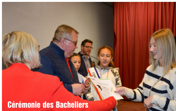
Cérémonie des Bacheliers