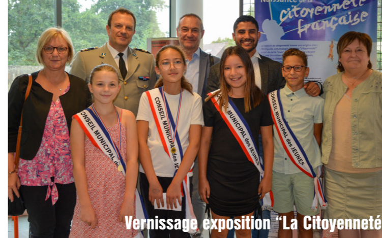
Vernissage exposition "La Citoyenneté"