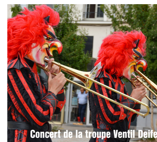
Concert de la troupe Ventil Deifel