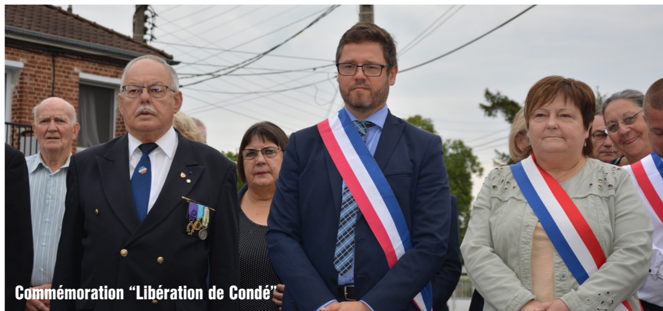
Commémoration "Libération de Condé"